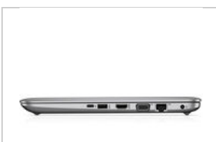
Left profile closed